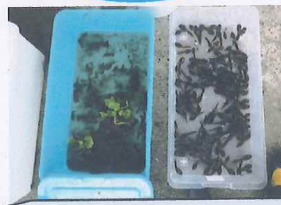
外堀のザリガニとオタマジャクシ ザリガニは あまり捕獲されません。