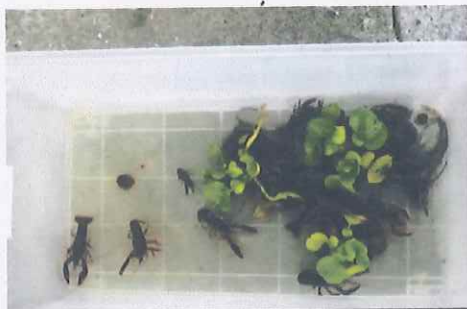
内堀のザリガニは めっきり減りました