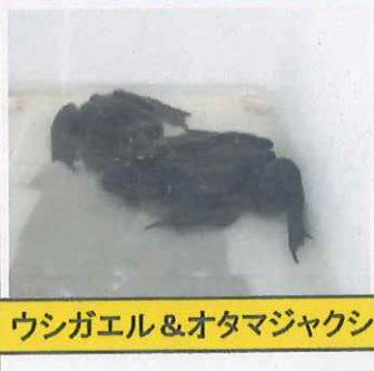
ウシガエル & オタマジャクシ