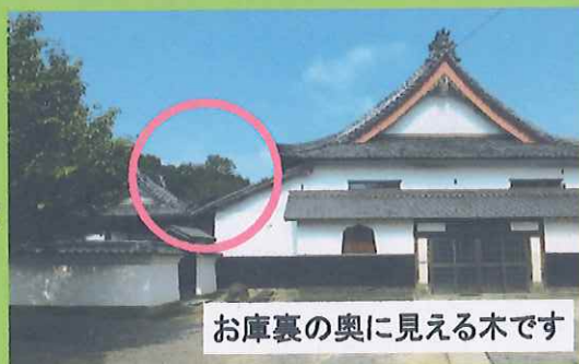
お庫裏の奥に見える木です